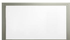
OX (O=Fast glas, X=Rörligt glas)