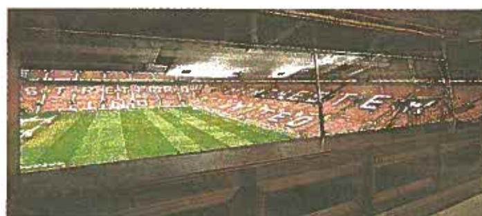
HYLLNING TILL SCHMEICHEL. Styrelsens viploge på Old Trafford är uppkallad efter den danske målvakten Peter Schmeichel. Den ligger direkt bakom målet på östra läktaren. Logen har nu två rörliga glasparterier på tillsammans 5,2 meter.